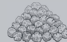
PARADIESKÖRNER GRAINS OF PARADISE