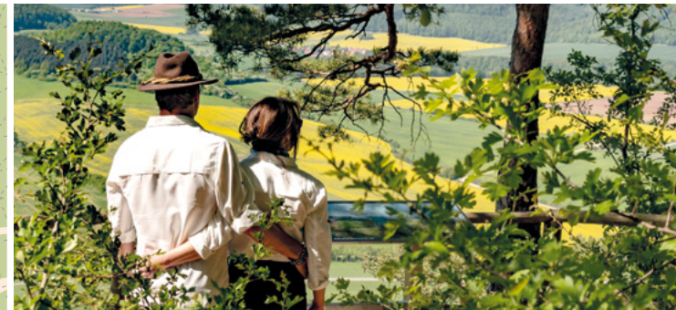
Kulturdenkmäler und Aussichtspunkte laden ein, zum Verweilen und Rasten.