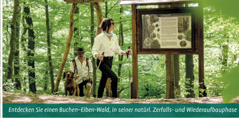
Entdecken Sie einen Buchen-Eiben-Wald, in seiner natürl. Zerfalls- und Wiederaufbauphase

Nicht nur die frische Luft um die sehenswerte Kurstadt, sondern auch zahlreiche kulturhistorische und naturkundliche Entdeckungen warten auf der ca. 13 km langen Rundstrecke auf dem 453 m hohen Höhenrücken aus Kalkstein.