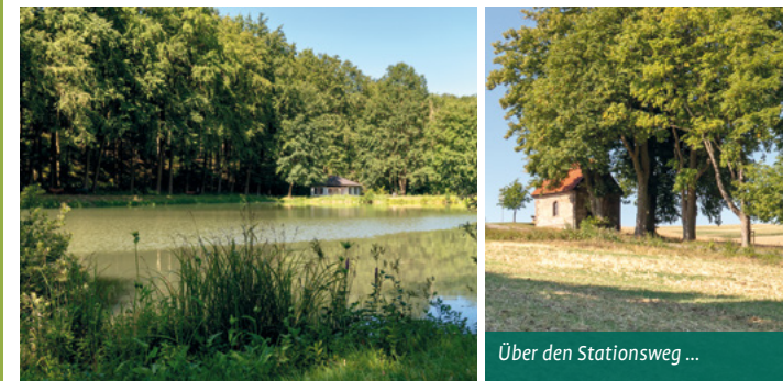
Über den Stationsweg ...