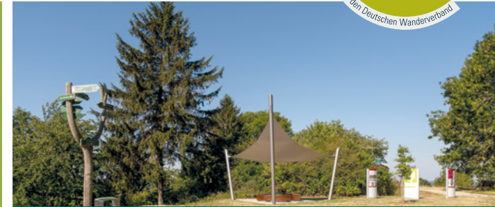
Der Wartberg bietet einen wunderbaren Panoramablick über das Eichsfeld.