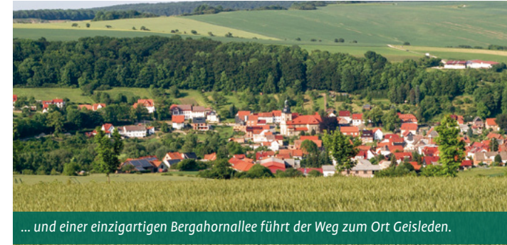
... und einer einzigartigen Bergahornallee führt der Weg zum Ort Geisleden.